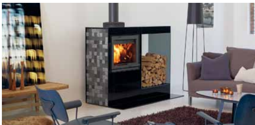
Jøtul Cube I 530 GL WS Glass / Lava stone, Wood Storage