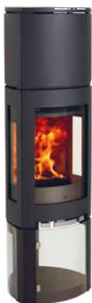
Jøtul F 376 HT