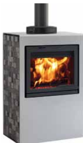
Jøtul Cube I 530 AL Aluminium / Lava stone