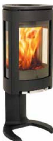
Jøtul F 374