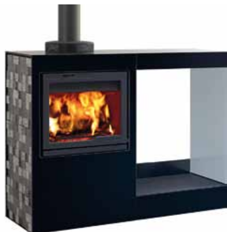
Jøtul Cube I 530 GL WS Glass / Lava stone, Wood Storage