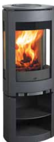
Jøtul F 371