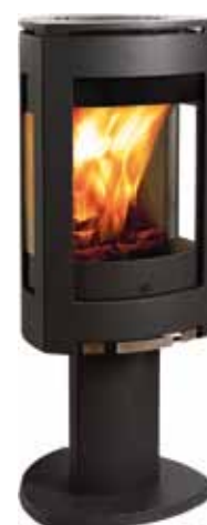
Jøtul F 373