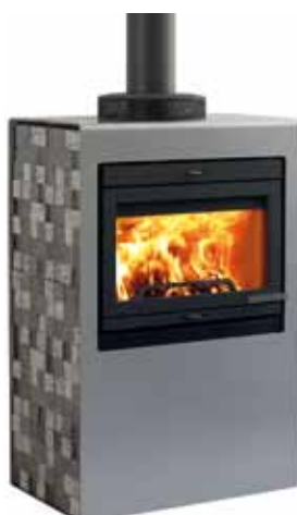
Jøtul Cube I 400 AL Aluminium / Lava stone