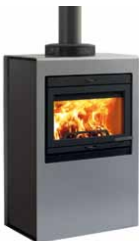
Jøtul Cube I 400 AG Aluminium / Glass