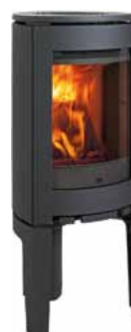
Jøtul F 369