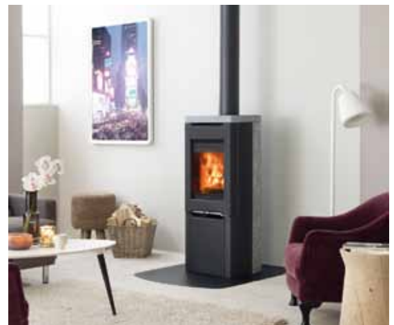
Jøtul F 262 S