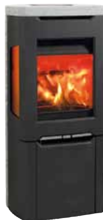
Jøtul F 263 S