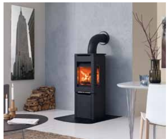
Jøtul F 263