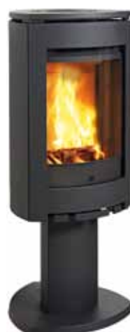
Jøtul F 363