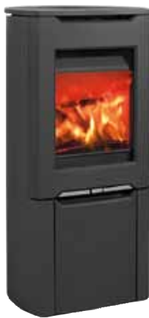
Jøtul F 262