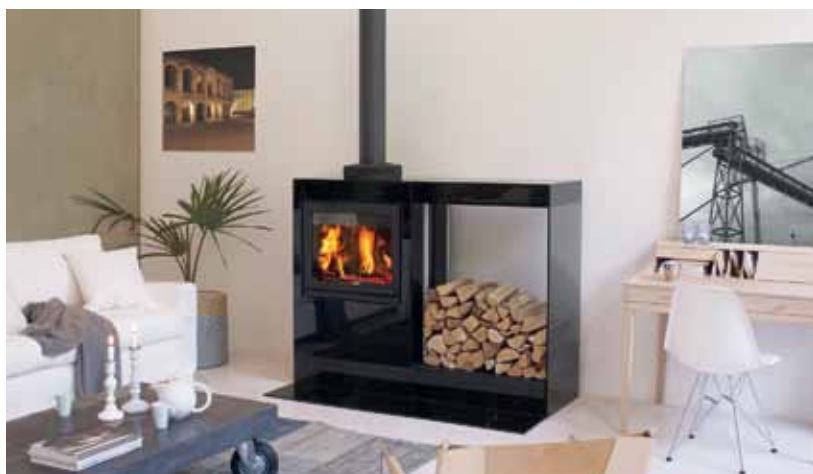
Jøtul Cube I 530 GG WS Glass / Glass, Wood Storage