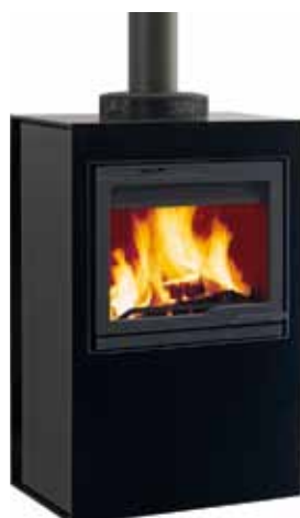
Jøtul Cube I 530 GG Glass / Glass