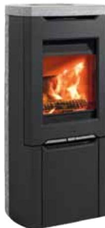
Jøtul F 262 S