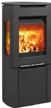
Jøtul F 263