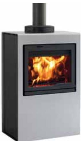
Jøtul Cube I 530 AG Aluminium / Glass