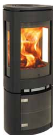
Jøtul F 375