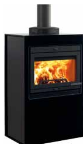
Jøtul Cube I 400 GG Glass / Glass